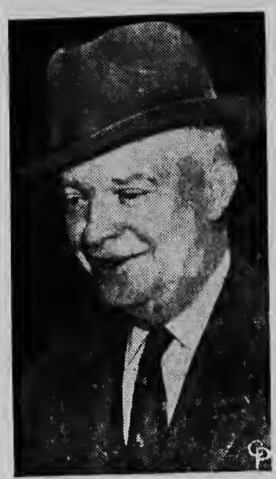
PRESIDENT Eisenhower is shown returning to the White House after his regular press conference, at which he announced the United States is delivering a new note to Russia on his plan to use atomic for peace. The Chief Executive said that "we are determined to get on with this international project whether or not the Soviets participate." The message is a reply to the Reds, who had indicated they apparently wanted to renew negotiations.